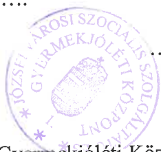
Takács Gábor intézményvezető